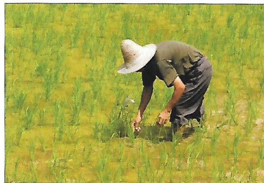
pěstování rýže – hlavní plodiny Číny

Velké oblibě se v Číně těší vepřové maso , chová se zde třetina světového počtu prasat . Zároveň Číňané loví nejvíce ryb na světě . Po tisíce let se v Číně chová bourec morušový – motýl, z jehož zámotků se získává pravé hedvábí .