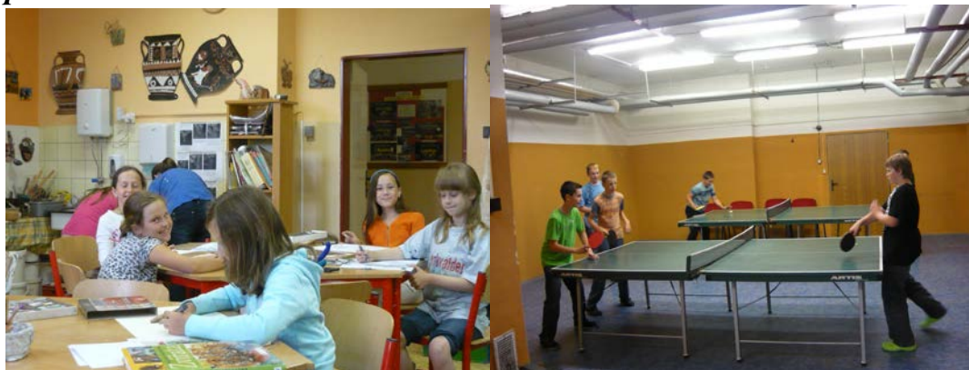
Picasso- výtvarný kroužek pro pokročilé

Odhlášení dítěte z kroužku je možné vždy k pololetí školního roku na základě písemného nebo ústního sdělení rodičů.