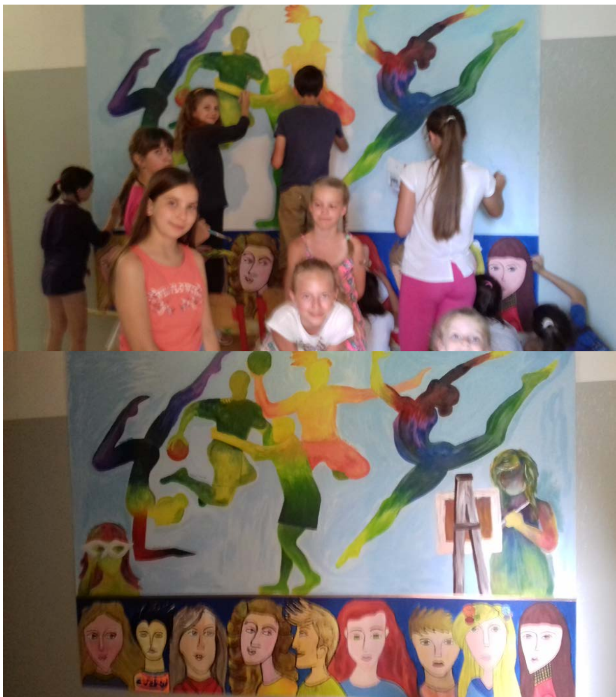
Práce dětí kroužku Picasso.