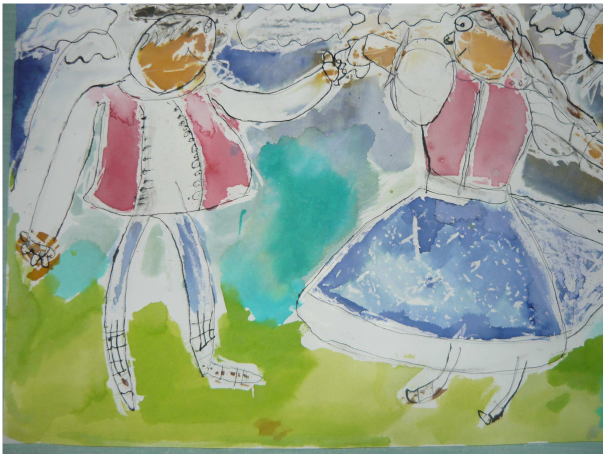
Práce Ondry Hyjáňka ze 3.B obdržela Čestné uznání v soutěži Lidická růže