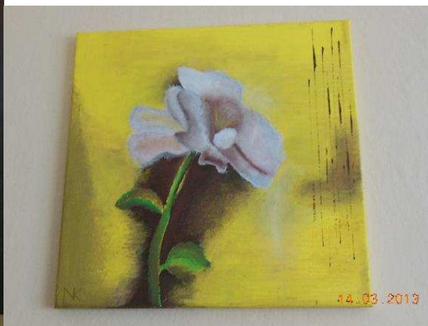
Nikol Krupová: Bílý květ