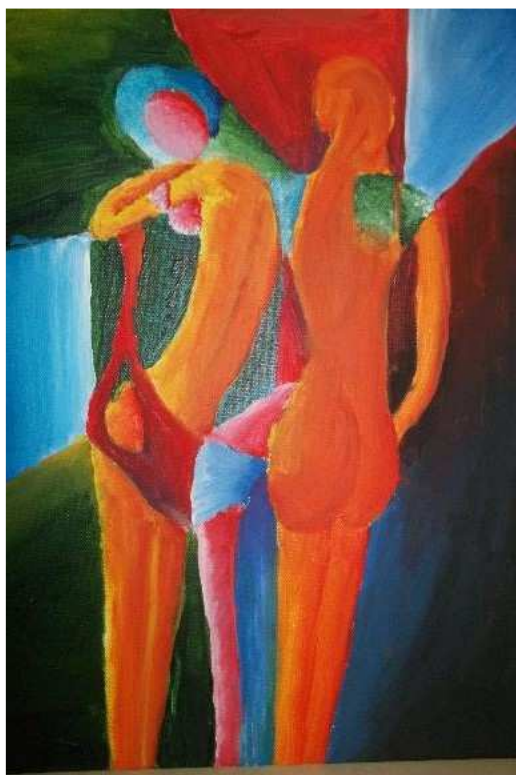
Matěj Lojkásek: Přátelé

Pokročilí malíři pracují většinou na svých nebo soutěžních tématech. Učí se malovat na malířská plátna a jiné dostupné materiály jako je dřevo, sklo a plast.